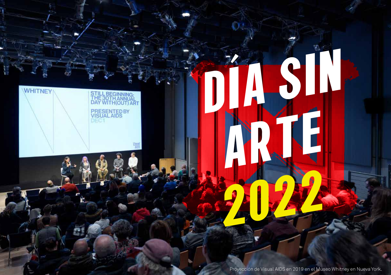
Proyección de Visual AIDS en 2019 en el Museo Whitney en Nueva York.