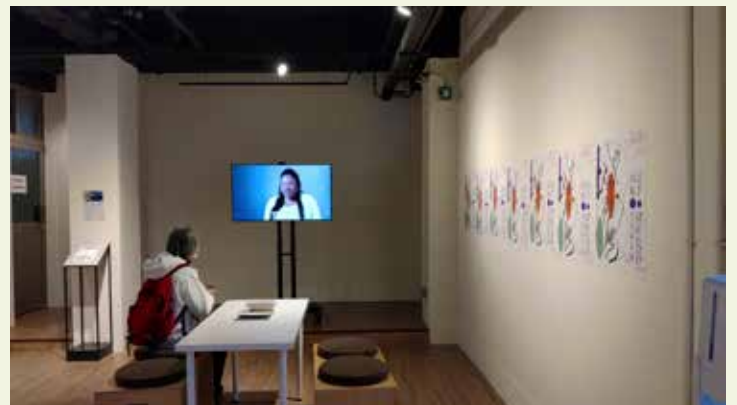
Una presentación en loop en el Laboratorio de Cultura Contemporánea de Taiwán en Taipei.

Para obtener un archivo completo de los anteriores videos comisionados, visite video.visualaids.org