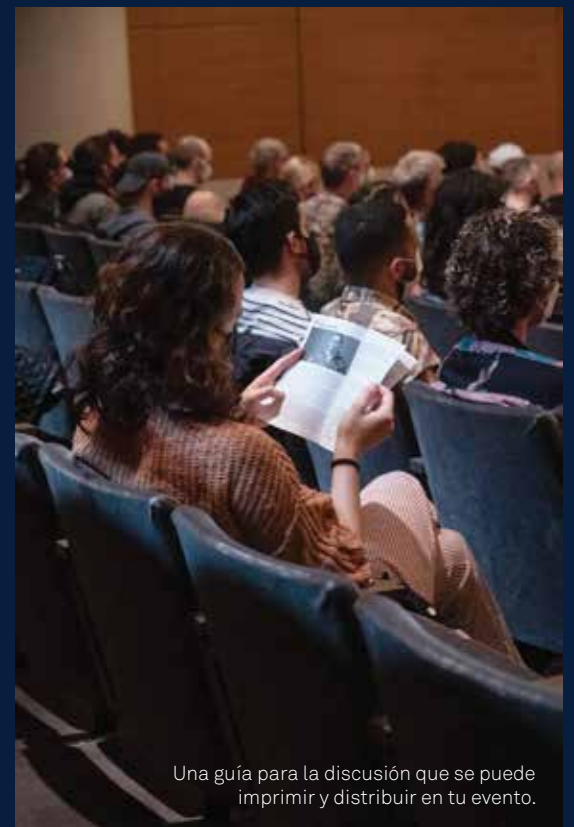
Una guía para la discusión que se puede imprimir y distribuir en tu evento.

Si estás interesado en participar, regístrate en https://sites.google.com/visualaids.org/dwa2022/espanol